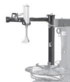
BPL pomocné montážní rameno