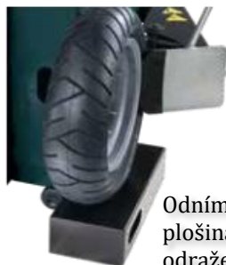
Odnímatelná plošina k odražeči